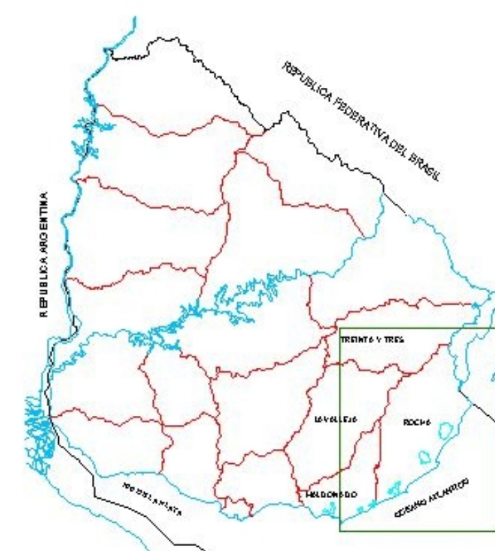
Fig. 1 Area de la RBBE 1976

Considerando el concepto de reserva de biosfera y las tres funciones complementarias que deben cumplir: a) función de conservación b) función de desarrollo c) función de apoyo logístico Se diseñaron cuestionarios a los efectos de realizar entrevistas a informantes calificados. El análisis de esta información, los antecedentes relevados y el conocimiento de la realidad fueron los insumos básicos de la propuesta de modificación de los límites de la RBBE que databan de 1976 En efecto, el área de RBBE inscrita oficialmente en el Programa MaB fijó sus límites ente los 33° y 35° S y entre los 53° y 55°O (Fig 1), destacando dentro de dichos límites la biodiversidad de unas 300.000 hectáreas de humedales